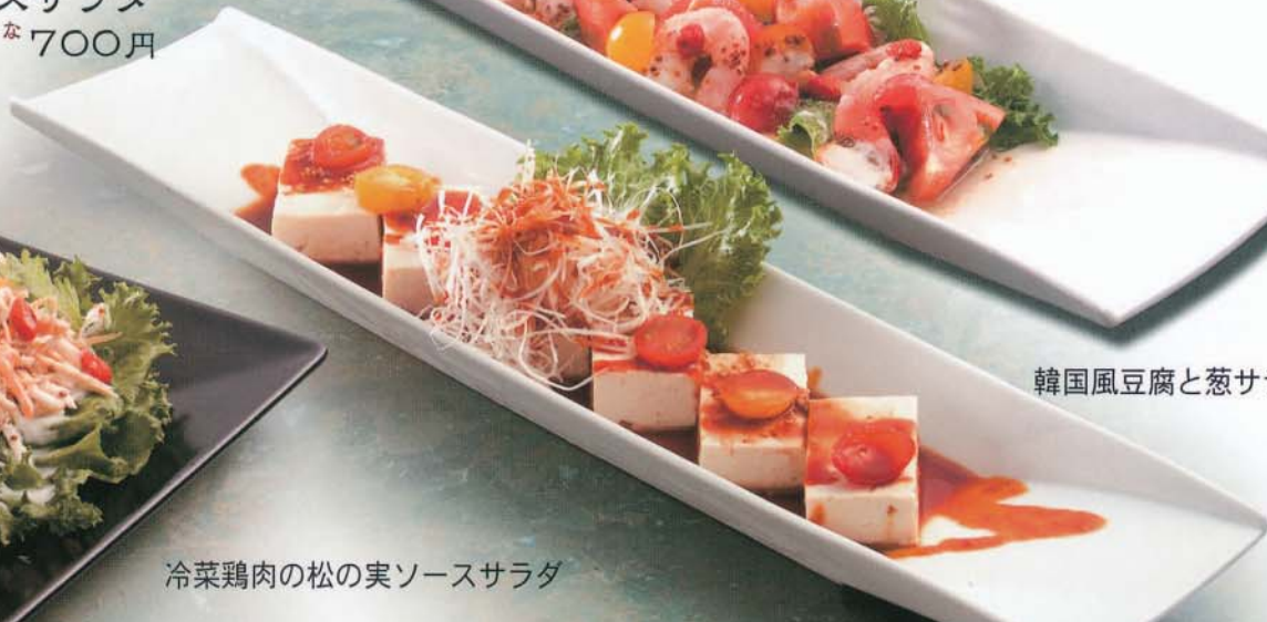
韓国風豆腐と葱サラダ