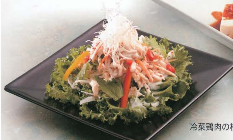
冷菜鶏肉の松の実ソースサラダ