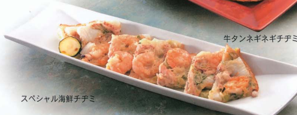
スペシャル海鮮チヂミ