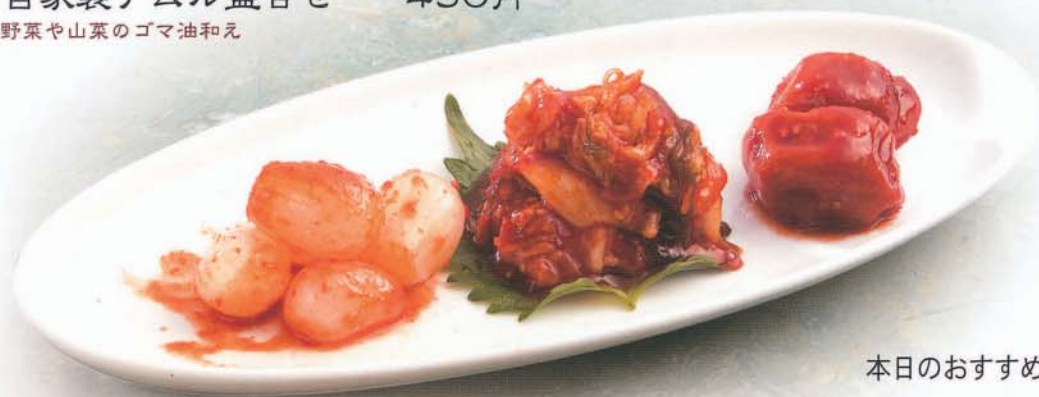
本日のおすすめキムチ三種盛