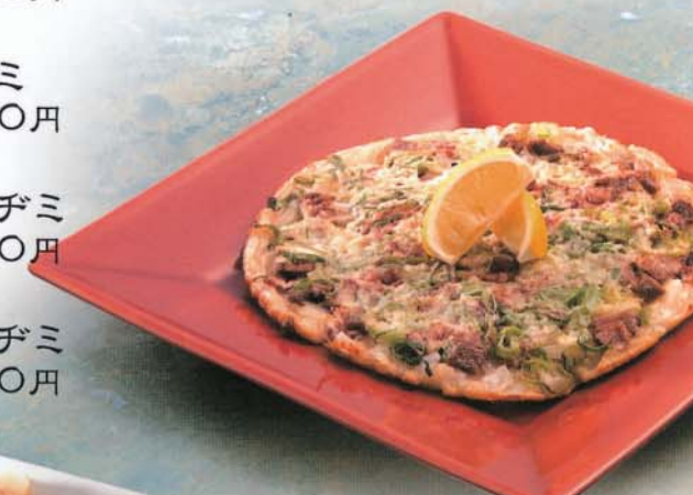
牛タンネギネギチヂミ