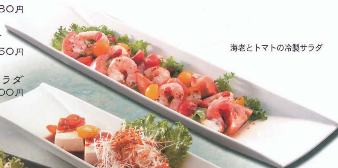
海老とトマトの冷製サラダ