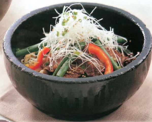
石焼葱カルビビビンバ