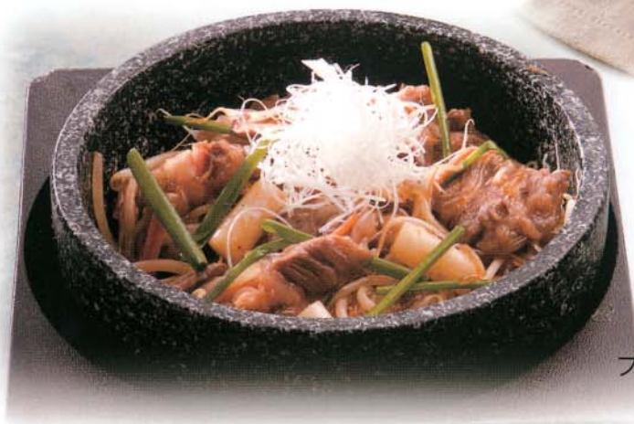
ブルコギビビンバ