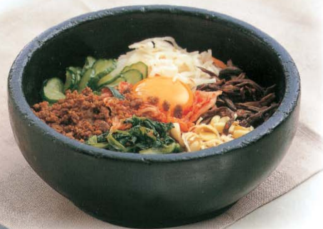
古宮庵石焼ビビンバ