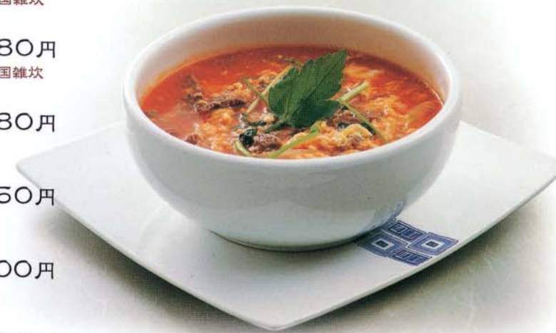
ユッケジャンクッパ