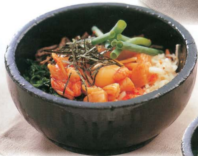
石焼海鮮ビビンバ