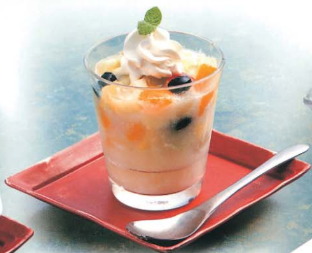
フルーツアイスソーダ