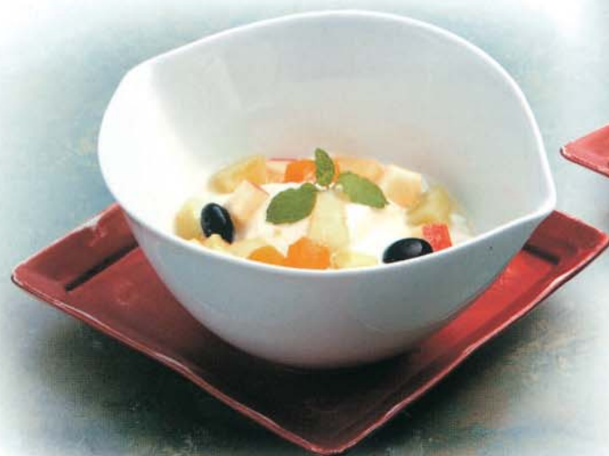
杏仁フルーツパフェ